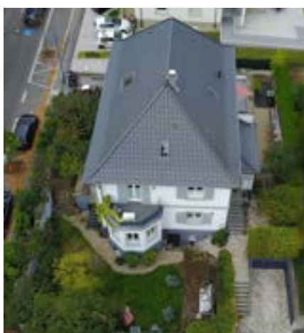
Wiesloch – Stipendiatenhaus