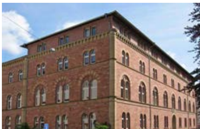
Romanisches Seminar